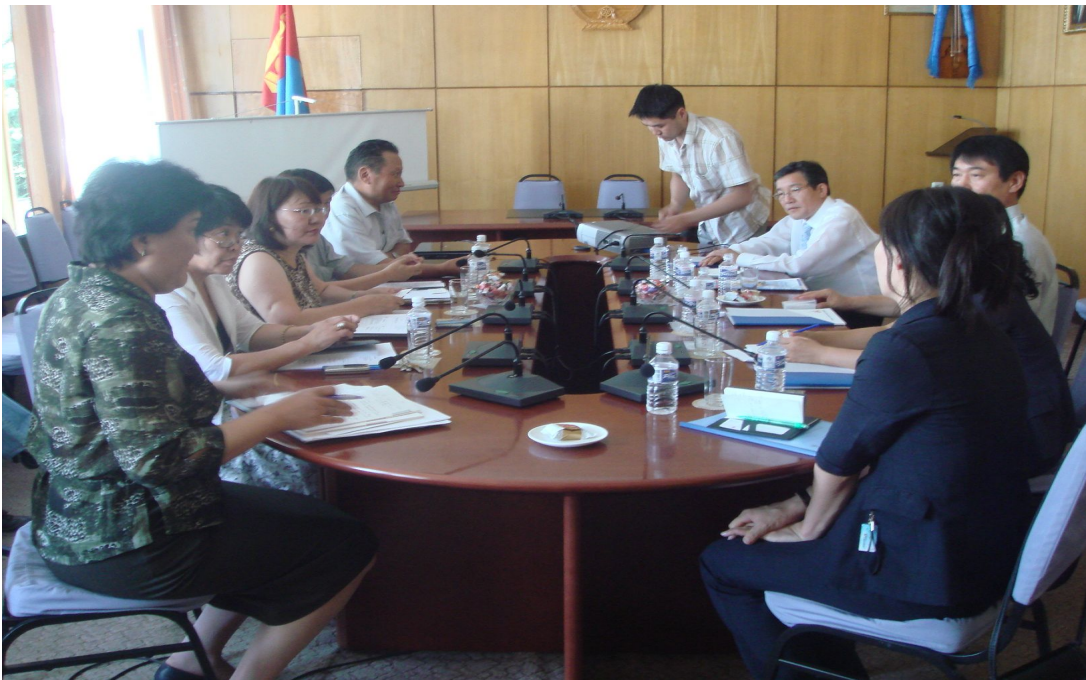
【몽골통계청 조직 개요의 발표를 준비하는 행정관리국장님】