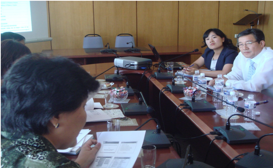
【질문에 대한 답변을 하시는 통계정책국장님】