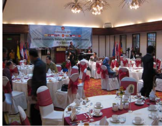
〈첫날 만찬장 모습〉