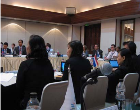
〈ACSS 위원회 회의〉