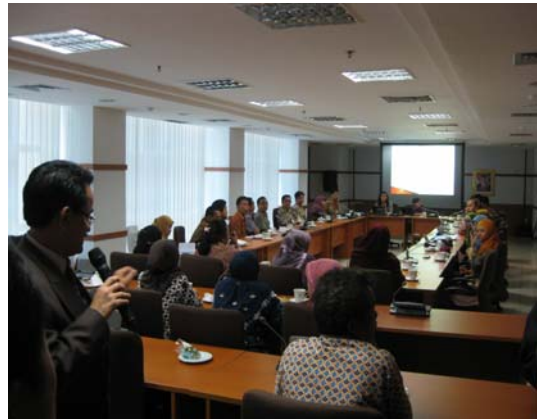
〈인도네시아 통계청 방문〉