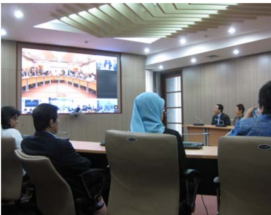
〈BPS 내의 화상 회의실〉