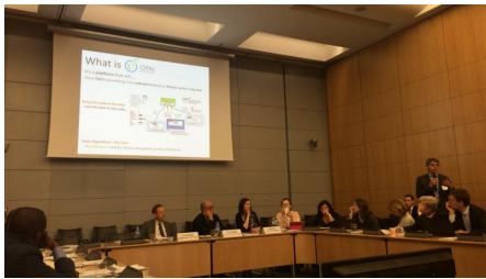
국가 사례 발표