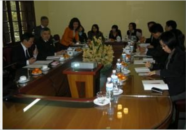
질의에 대한 GSO의 응답, GSO 현황, 농어업 통계 발표