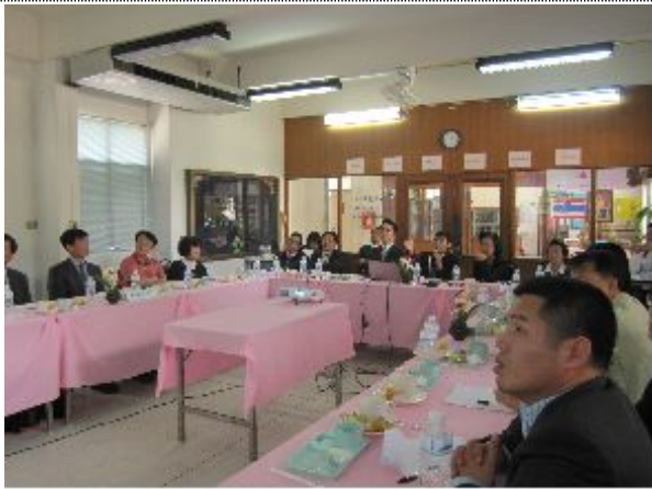
- 동북지방통계청 소개 -