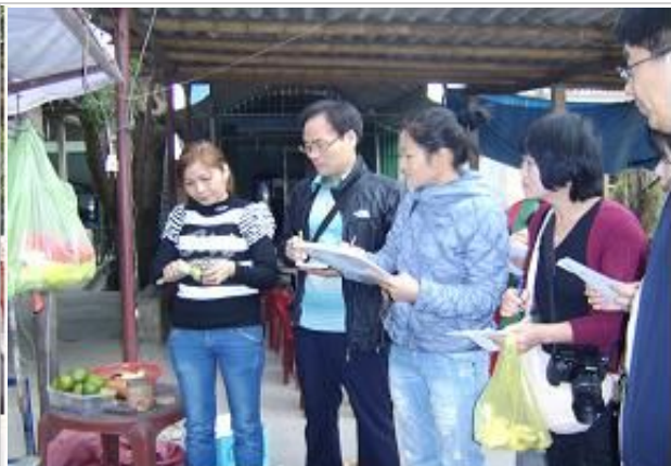
사업체조사 조사원의 면접조사 모습