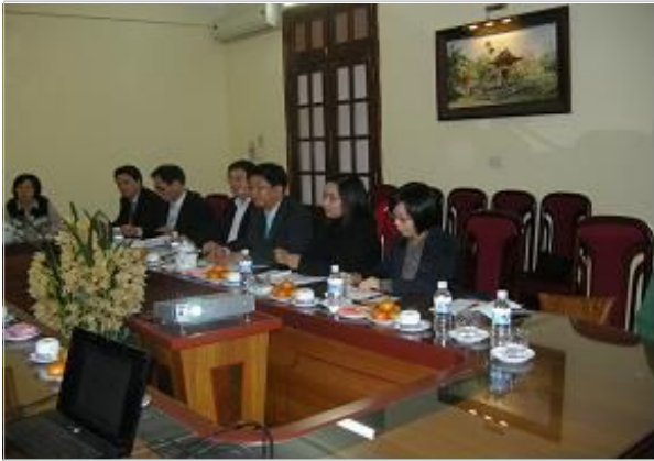
KOSTAT 대표단 질의