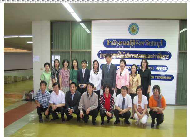
- 촌부리 지방사무소 방문 단체사진 -