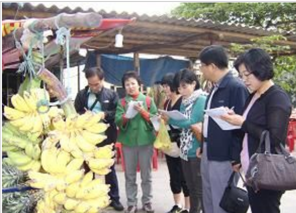
사업체조사(과일 도소매업) 조사 대상처 방문