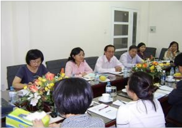
호치민 지방통계청 소개 / 통계개요 설명