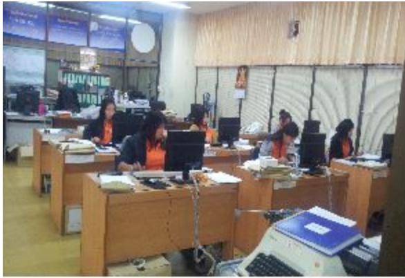
- 조사원 유니폼 입고 근무하는 광경 - (춘부리 지방사무소)