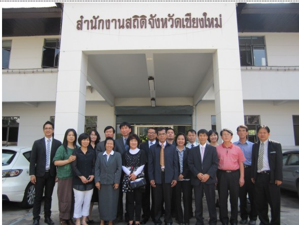
- 치앙마이 지방사무소 방문 단체사진 -