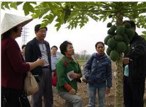
파파야 재배 농장 방문 설명