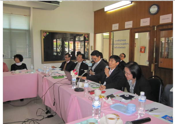
- 태국 통계청 질의에 대한 응답 및 상호 현장 경험에 대한 토의