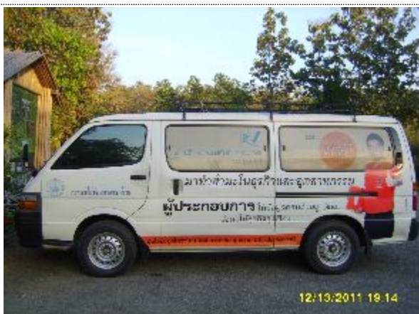
- 치앙마이 지방사무소 승합차 홍보 I - (태국 유명배우 MA DEE)

☞ 우리청에도 홍보부서인 대변인실이 있다. 그리고 홍보예산은 각 사업별로 각 사무소에 배정을 한다. 그리고 노동청, 보건청 등 각 부처에 협조를 구하여 사업을 추진한다. 특이한 사항은 2010년 인구주택총조사시에는 유명한 배우를 지역별로 1일 조사원으로 채용하여 대대적인 마스크 홍보로 조사참여를 적극적으로 유도 하였던 점이다.