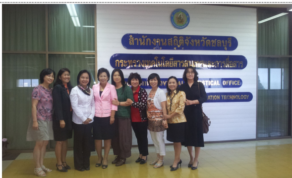
- 촌부리 지방사무소 방문 I -