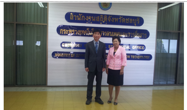
- 촌부리 지방사무소 방문 II -