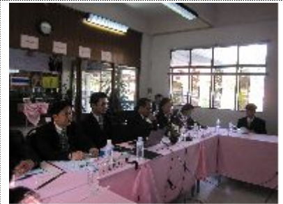
- 상호 질의응답 - (치앙마이 지방사무소)

☞ 우리 지방사무소는 한국과는 다르다. 국가 통계뿐만 아니라, 각 부처 및 지자체에서 요구하는 통계조사도 실시하여야 한다. 예를 들면 시정책 만족도조사, 마약 실태에 대한 여론조사, 총지역소득조사, 공무원생활여건조사 등을 수행한다. 따라서 업무량은 많지만 적은 인력으로 알차게 계획을 세워서 추진하고, 추진이 완료가 되지 않으면 연장 계획을 세워서 추진한다.