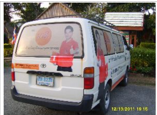
- 치앙마이 지방사무소 승합차 홍보 II - (태국 유명배우 MA DEE)