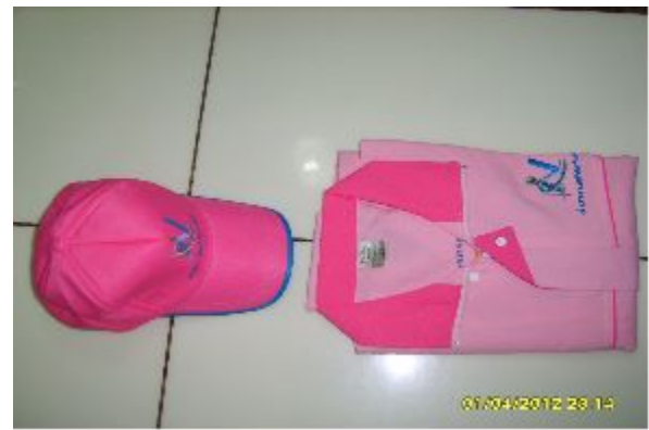
- 2010 인구주택총조사 유니폼 및 모자 -