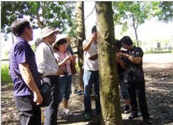
고무 농장 방문