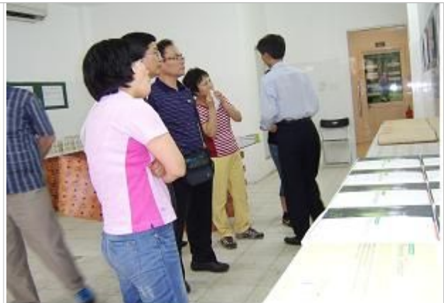
피톤치드가공제품 도소매업체 방문