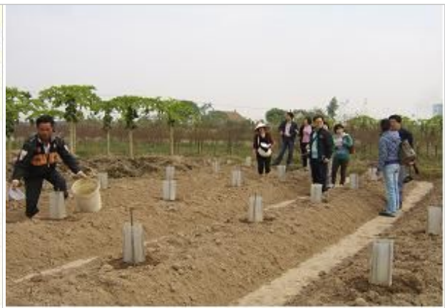
파파야 묘목 재배와 성과수 비교