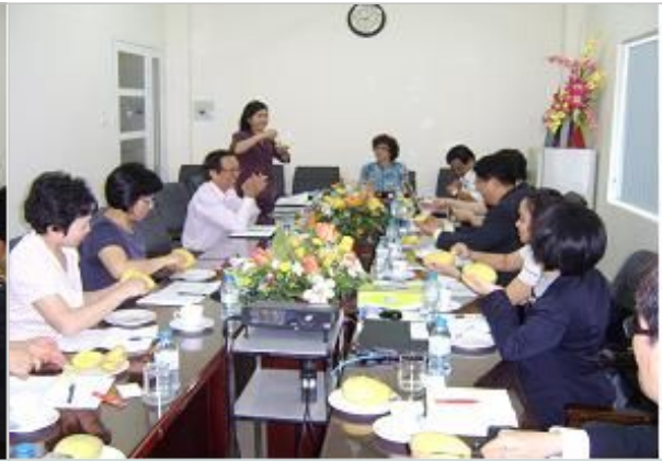
호치민 특산품 망고 먹는법 시연 (베트남 농어업통계과장)