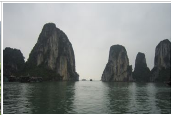
Ha Long Bay