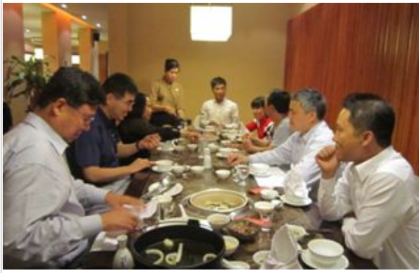
Ashima( www.ashima.com.vn )