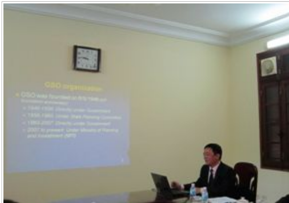
베트남 통계시스템 설명