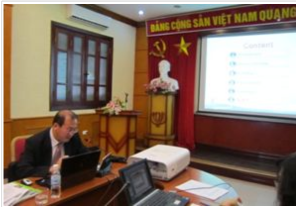
한국의 경제센서스 설명