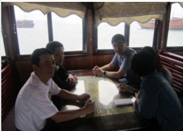
광닌 지방통계청장 업무소개