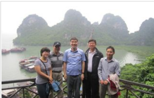
Ha Long Bay