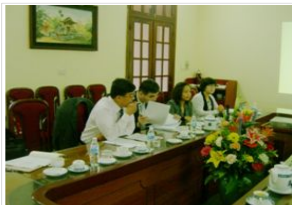
한국 통계교육현황 설명