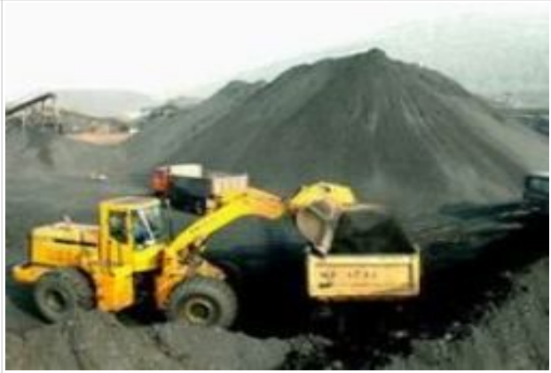
광닌성 석탄산업 현장