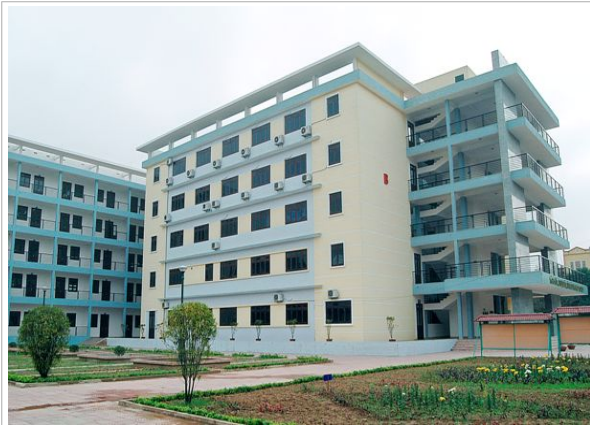
Bac Ninh Statistical College 전경