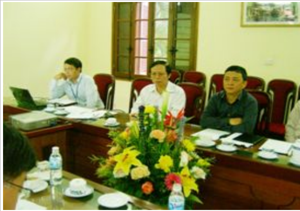
베트남 통계청장 말씀