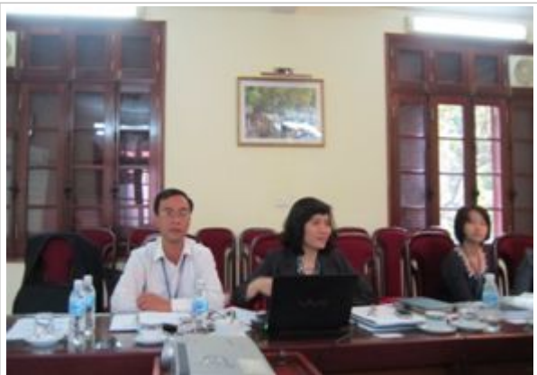
베트남 사업체총조사 설명