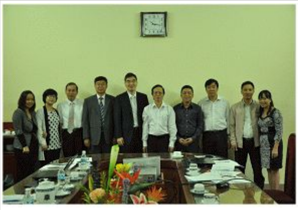
베트남 통계청장과 기념촬영