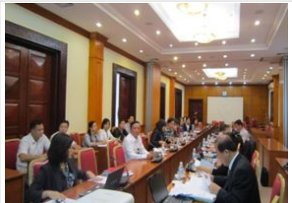
베트남 사업체총조사 담당자들