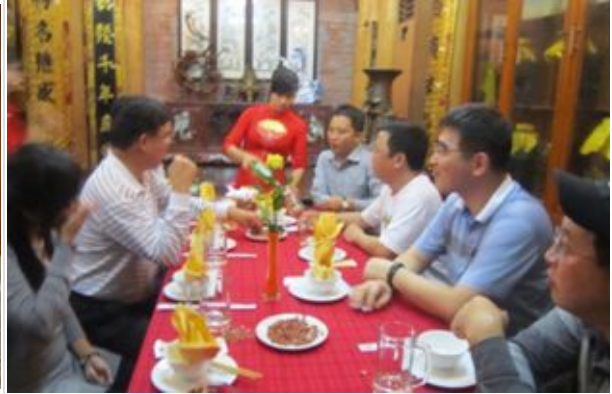
Phu Son Resort( www.phusonresort.com )