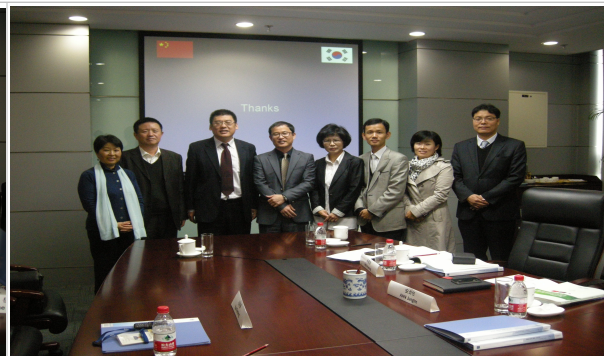
북경에서 회의 마치며 기념촬영