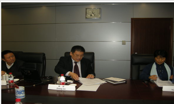
북경에서 2012년 국제협력사항 논의