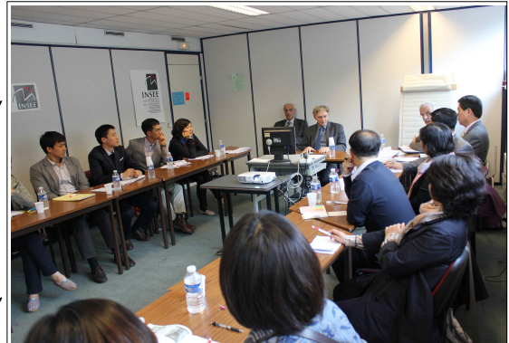
<INSEE 방문 전경>