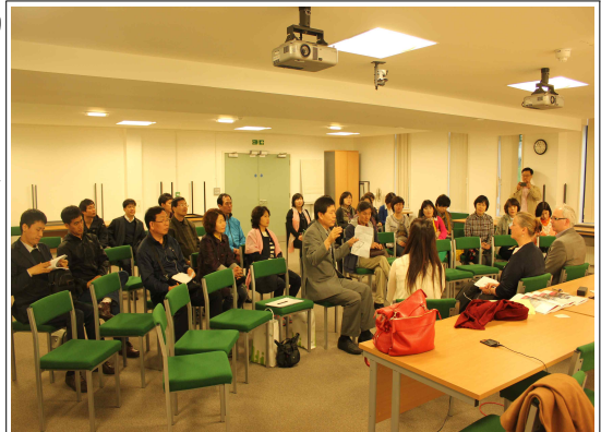
<ISER 방문 전경>