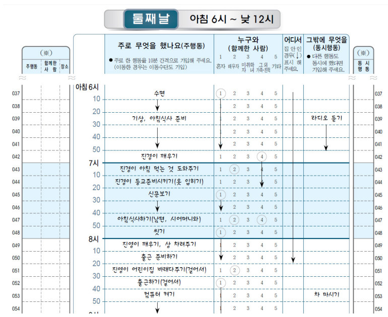
[그림 2-1] 한국생활시간조사 시간일지 형태

가장 최근 조사인 2009년에 실시한 제3회 조사에서는 이전 조사에 비해 표본추출에 변화가 있었는데, 사회통계조사 표본조사구를 이용하여 표본을 추출하고, 조사 횟수를 1회에서 2회로 늘려 조사시점(계절)의 차이에 따라 다양한 행동들을 더 많이 측정하고자 하였다.