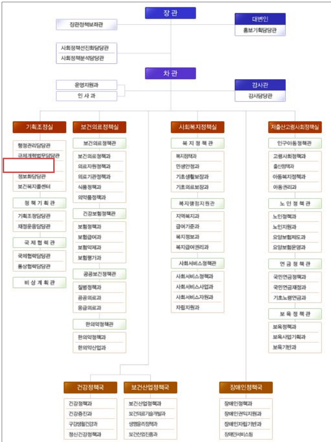
<그림 2> 보건복지부의 조직도