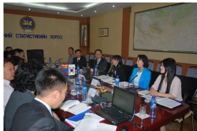
[ 회의장 전경 2 ]