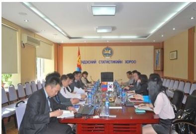
[ 몽골통계청장 및 간부 접견 ]