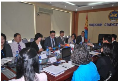
[ 회의장 전경 1 ]