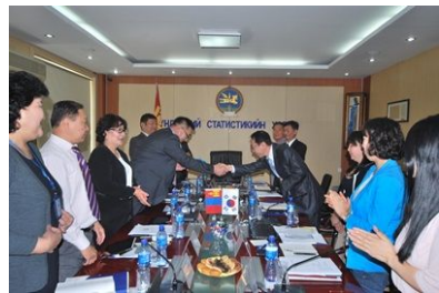
[ 몽골통계청 기관선물 증정 ]