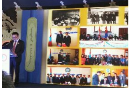
몽골통계청의 주요 협력파트너 소개 (우리 청은 화면 좌측 하단에 위치)