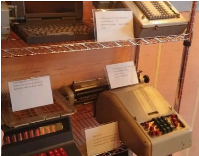
통계자료처리에 사용된 역대 주요 도구 전시