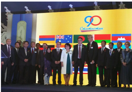
기념행사에 초청된 주요 외빈