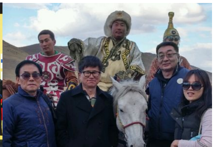
마상 공연 후 몽골통계청장과 대표단