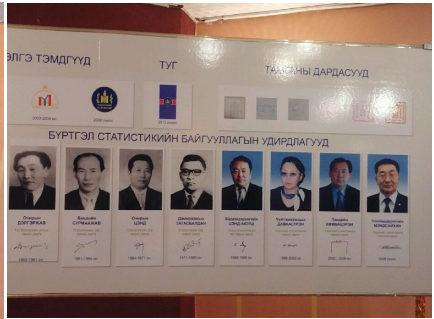
몽골 통계청의 역대 표식, 직인 및 청장