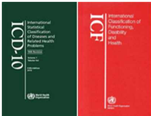
[기존] 분류별 개별 작성·운영